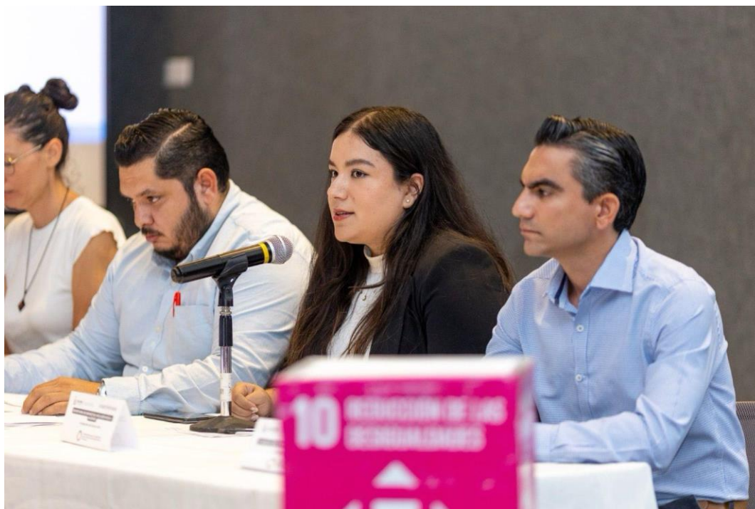
Aprobación del Programa de la Agenda 2030 para el Desarrollo Sostenible del Estado de Colima