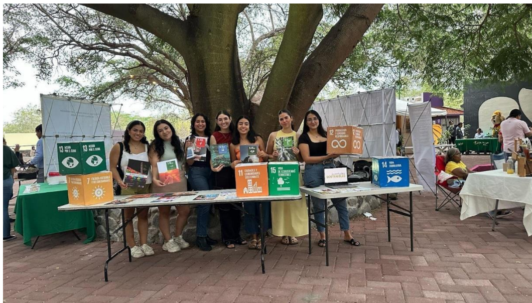
Parte del equipo de la organización Juventudes Sostenibles, en una exposición de los ODS.