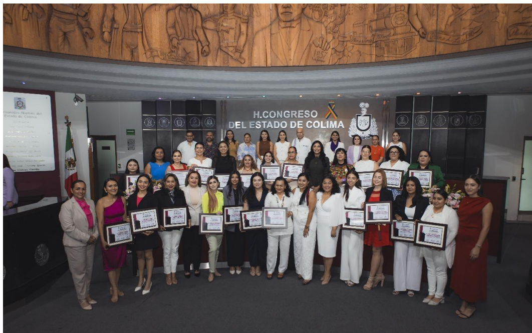
Participantes Parlamentarias en el H. Congreso del Estado de Colima.