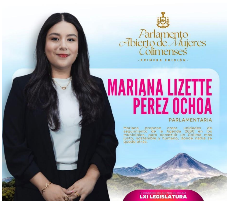
Flyer de propuesta de iniciativa